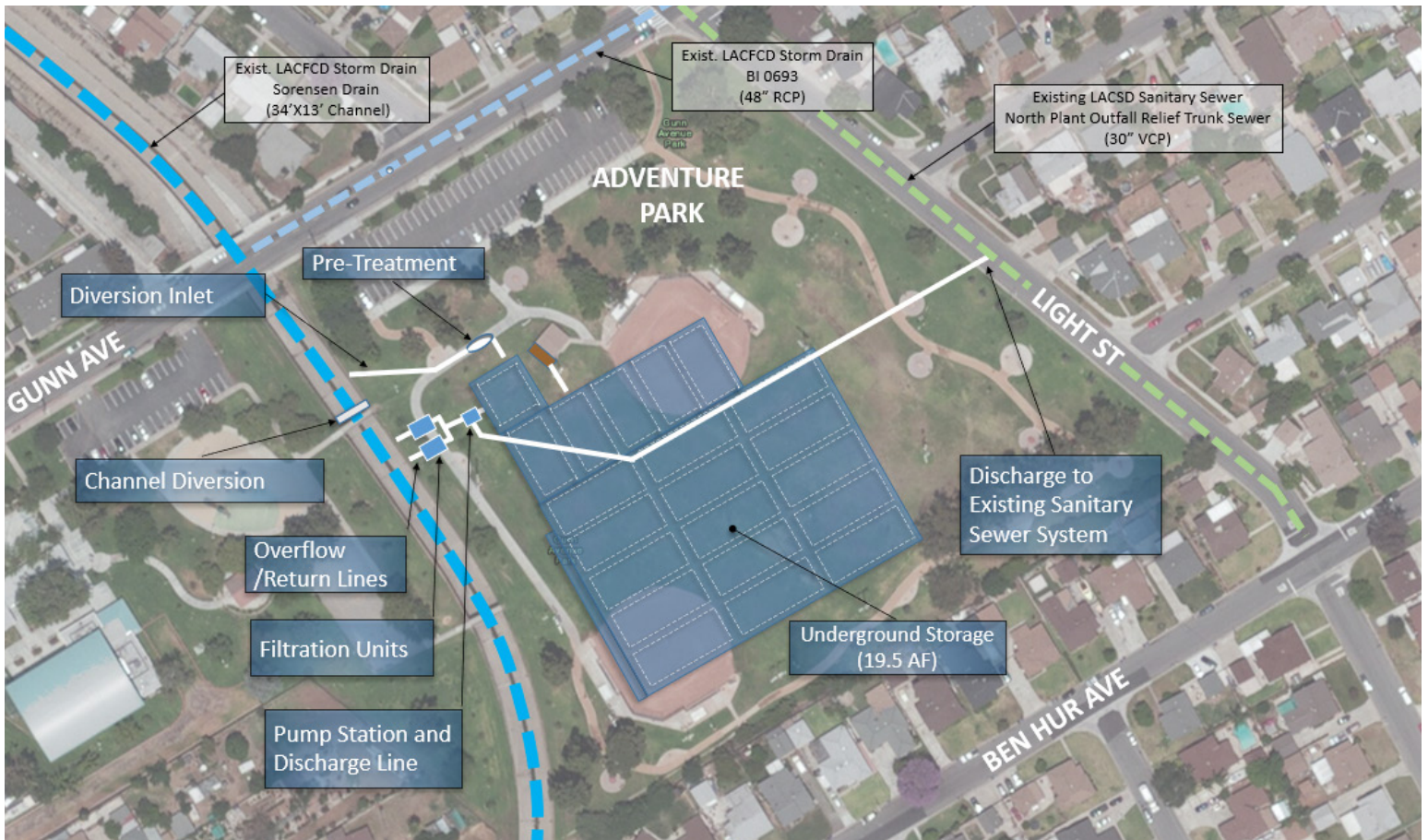
Sistema subterráneo de tratamiento de aguas pluviales